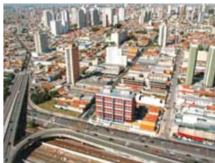
Zona Leste: em plena verticalização

A Zona Leste, diversificada tanto do ponto de vista comercial quanto do residencial, está em plena urbanização e regularização das áreas de risco, com a canalização de córregos e do rio Aricanu, além da verticalização imobiliária.