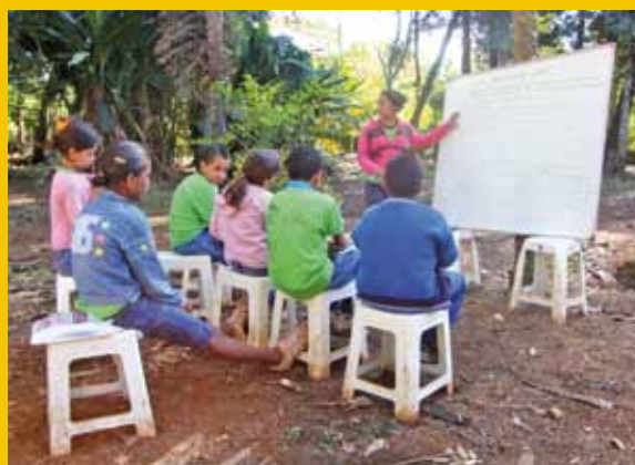
Arquivo Etec São Joaquim da Barra