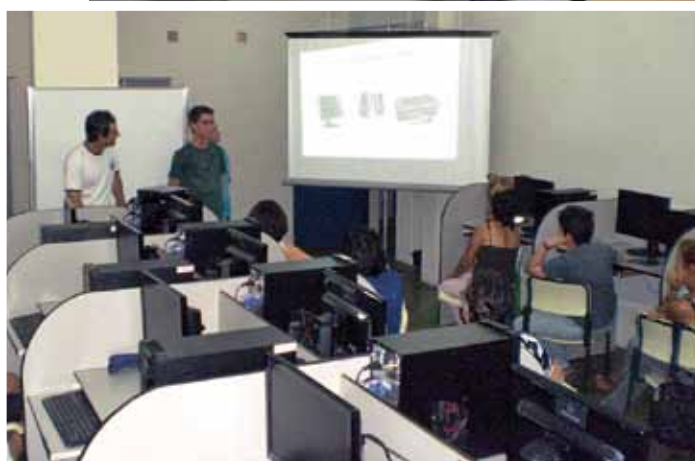
Click Melhor Idade, projeto da Fatec Jales