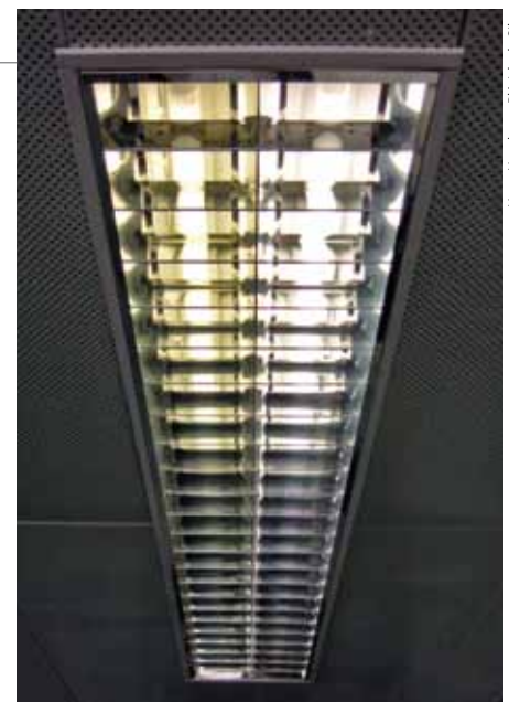
Disciplina de Eficiência Energética irá orientar o uso de luminárias e equipamentos econômicos

o plantio de 16 mil mudas de pinus e eucalipto. “A empresa forneceu material clonado de altíssima qualidade, fonte de pesquisa para alunos e professores”, ressalta Mello.