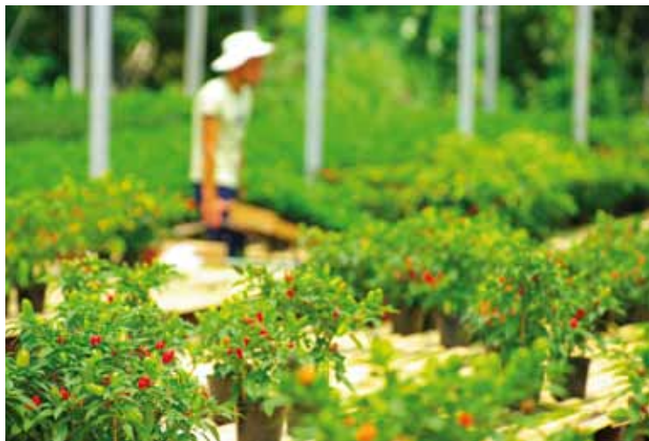
Agroecologia: diferencial para pequenos produtores

Agroecologia – ministrado desde 2007, enfatiza os sistemas orgânicos de produção, orientando sobre controle natural e biológico de insetos e doenças. Atende a produtores da agricultura familiar, que podem agregar valor aos seus produtos com a certificação orgânica. “Nossos alunos são na maioria filhos de pequenos produtores,