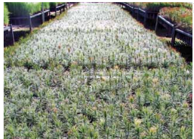
Técnico em Florestas faz manejo de espécies como pinus e eucalipto